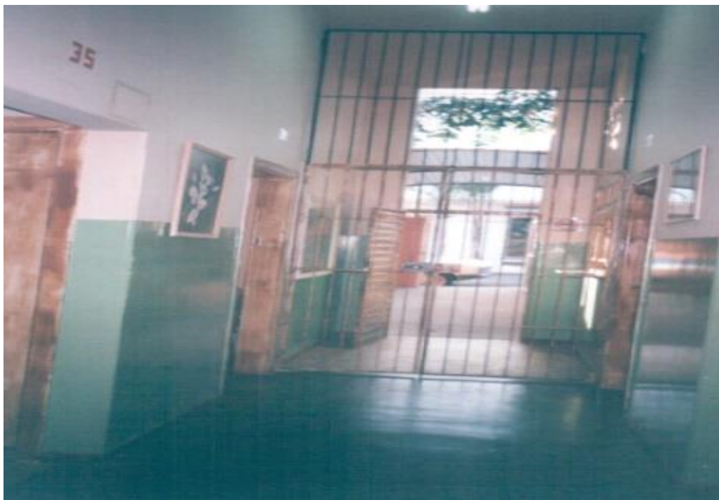
Área interna

Em 2008, o CEES Marília passou a denominar-se CEES Prof. a Sebastiana Ulian Pessine (Lei n. 12.974 05/05/2008, DOE de 06/05/2008).